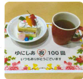
わたしの サンクスケーキ