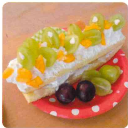
オータム デコレーションケーキ