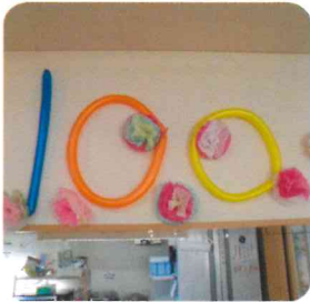
手作りの飾り付け