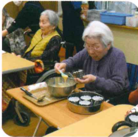
みんなで楽しく つくりますよ。