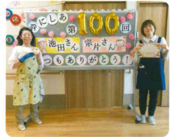
いつもありがとうございます！