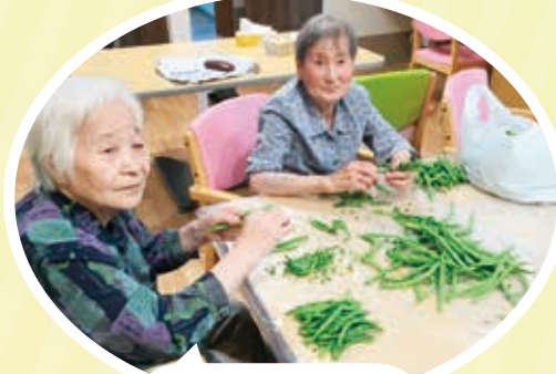
ささぎのすじ取り