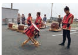
大曽根太鼓保存会様 和太鼓