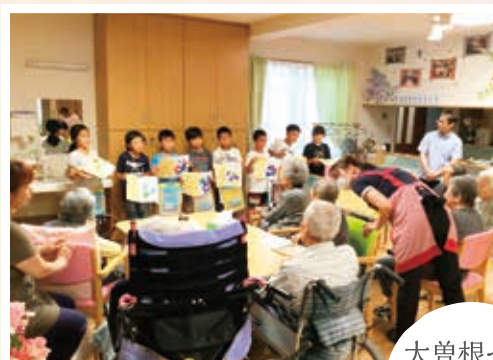
大曾根小の 児童の みなさん