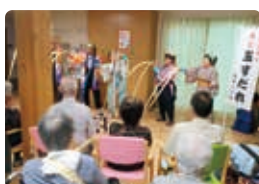
カモミール様 南京玉すだれ