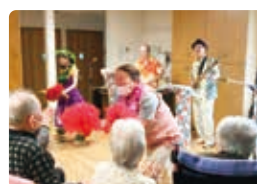
南国一座様 ハワイアン&ムードミュージック

施設開所から2年目を迎えました。4月の1周年記念のイベントでは大曽根太鼓保存会のみなさまに迫力ある太鼓を聴かせていただき、地元の小中学校のみなさんの学習の場として利用者さまと交流をしていただくなど、改めて地域の方の支えをありがたく思います。 今年度は、特養の各ユニットや小規模多機能でも外出やイベントを増やし、新たに担当居室制を取り入れました。利用者さま、入居者さまの笑顔が見られるよう、職員一同励んでいきたいと思っております。また、来年度はご家族や地域の方もご参加いただけるような行事を予定しておりますので、どうぞご期待ください。 四釜