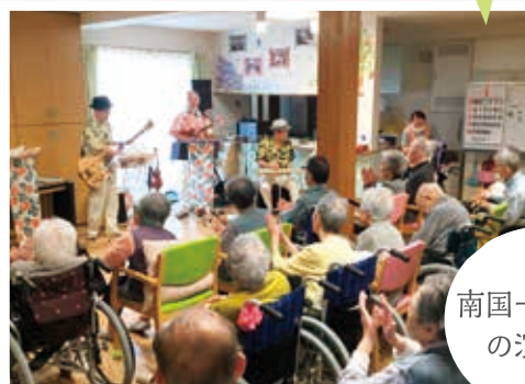
南国一座さん の演奏会