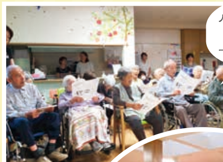
ハーモニカバンドの 演奏を聴きながら 一緒にうたいました