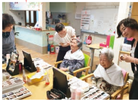
メイクを してもらいました