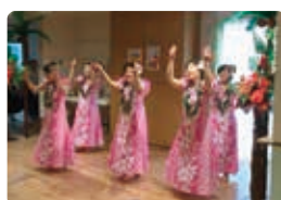
レイ・アロハ様 フラダンス