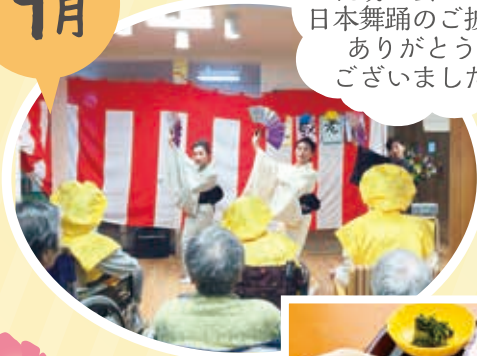
花萌の会さま 日本舞踊のご披露 ありがとうございました