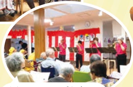
飯塚ハーモニカ愛好会さま ありがとうございました