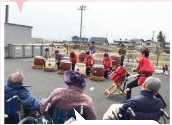
大曽根太鼓保存会の演奏を聞きました