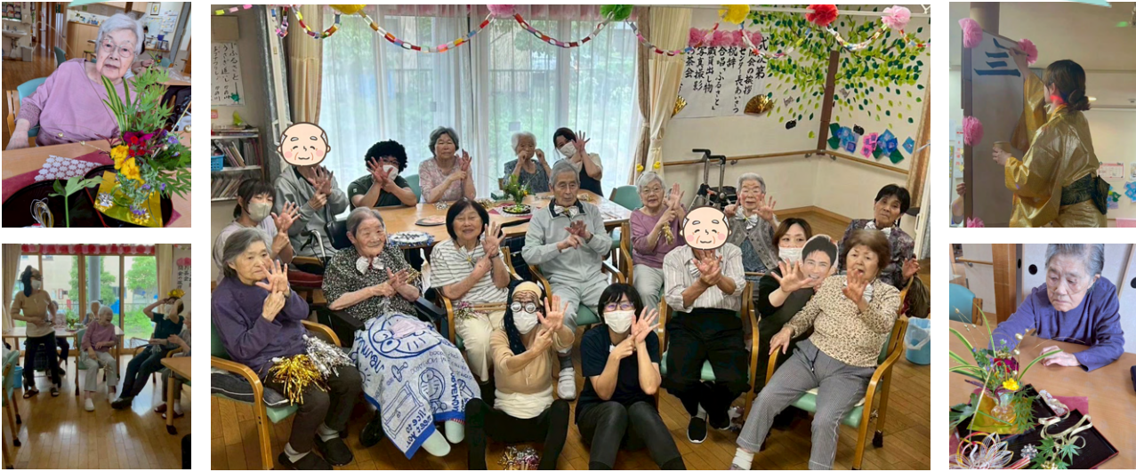
個性あふれる出し物で大いに盛り上がり、笑顔あふれる時間になりました。