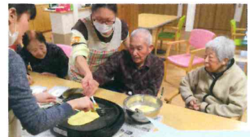
手作りどんどん焼き