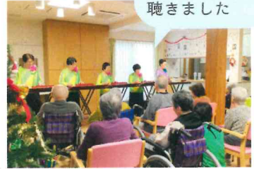
大正琴の演奏を 聴きました