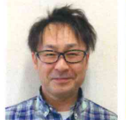
小規模特別養護 老人ホーム大曾根