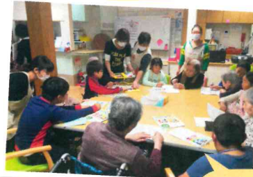
大曾根小のみなさんと