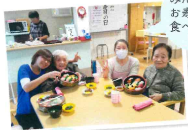
みんなで お寿司を 食べました