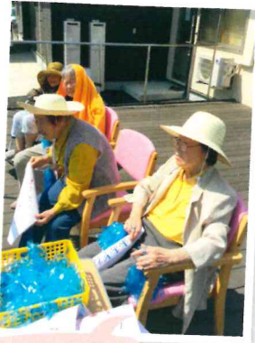
運動会応援 がんばれ～